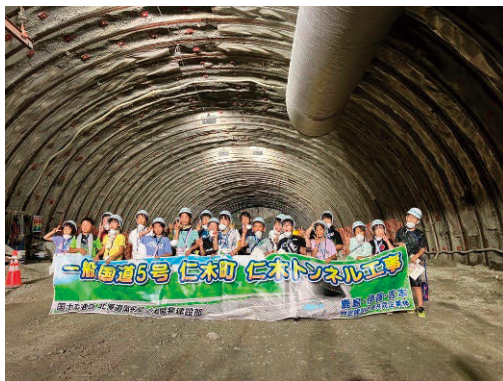
見学終了後にトンネル内で記念撮影