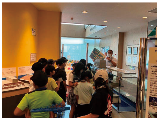
小樽港湾事務所の方による説明

また、見学の合間には当支部で作成した広報冊子「あなたの周りにも ～建設コンサルタントのしごと～」を用いた出前講座を開催し、人々と社会インフラとの関わりやその整備に関わる仕事について分かりやすく解説しました。