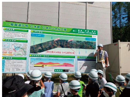
小樽道路事務所の方による説明